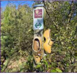
Park der Engel.

tenberg und Zahna-Elster gelegen). Von dort aus pilgern wir ca. 11 km. Unser Rundweg führt uns zum Park der Engel.