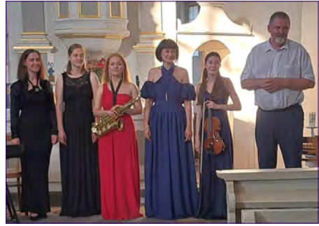
Belarussische Künstler begeisterten 2025 die Zuhörenden.

Herzlich wird zu dem traditionellen Sommermusikonzert mit den Künstlern aus Belaruss in die Bonifatiuskirche Hundeluft eingeladen. Es findet am Sonntag, dem 19. Juli um 18.00 Uhr statt. Wir freuen uns auf einen schönen Sommerabend und werden unsere Kirchentür weit öffnen. Chr. Rohr