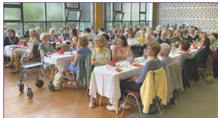
Frauenmahl 2025 in Dessau.