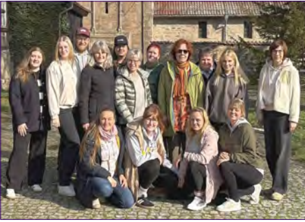
Kita-Team Rodleben in Drübeck.

den „Deutschen Kita-Preis“ gewonnen hat. Besonders spannend für uns: die „offene Arbeit“, die auch wir in unserer Einrichtung leben. Viele Eindrücke haben wir für unseren Kita-Alltag mitnehmen können. Ebenso nutzten wir die Zeit, um an unserer eigenen Konzeption zu arbeiten. Am Abend ging es dann in das Kloster Drübeck – ein Ort, den wir schon gut kennen und der perfekt ist, um gemeinsam zur Ruhe zu kommen, sich auszutauschen und neue Gedanken zu sortieren.