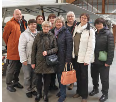
Frauenkreis Natho in Wernigerode.

Vom 13. bis 15. März fand wieder die jährliche Frauenfreizeit des Nathoer Frauenkreises in Wernigerode statt. In diesem Jahr stand das Thema „Transportmittel in der Bibel“ im Mittelpunkt. Neben der Bibelarbeit gestaltete jede kreativ einen Eselskarren aus Ton. Der übliche Ausflug wurde zum Luftfahrtmuseum in Wernigerode unternommen. Schon jetzt freuen wir uns auf die nächste Freizeit im Jahr 2027. J. Tobies