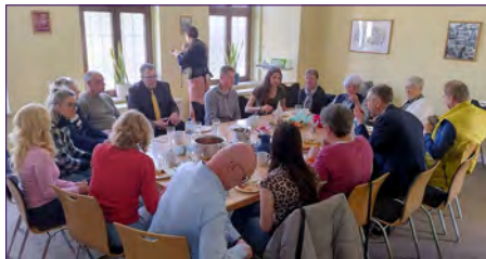
Brunch nach dem Gottesdienst in der Sakristei.

Am Sonntag Jubilate, dem 26. April gab es einen etwas anderen Gottesdienst in Roßlau, nicht zuletzt wegen der Anfangszeit um 11 Uhr.